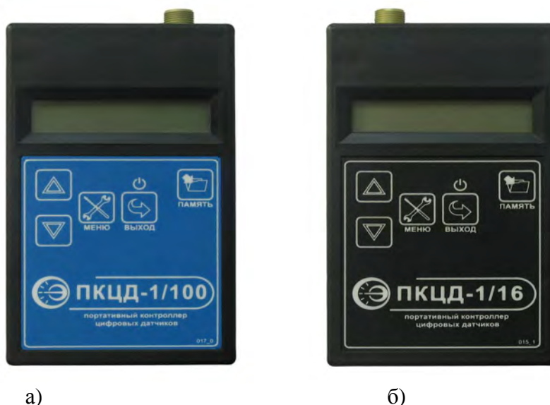
Рисунок 1. Внешний вид контроллеров ПКЦД а) ПКЦД-1/100 б) ПКЦД-1/16

Места размещения маркировки и пломбы для защиты от несанкционированного доступа указаны на рисунке 2.